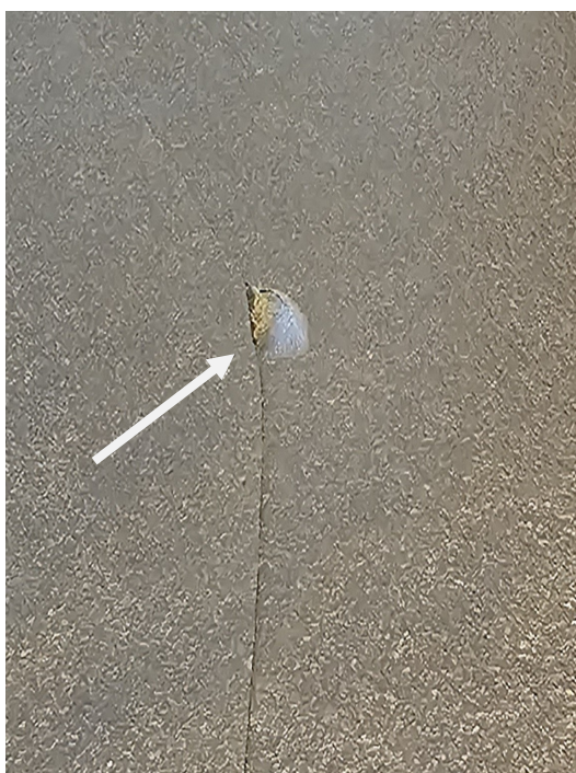
Her ses afslået flig i revnen.