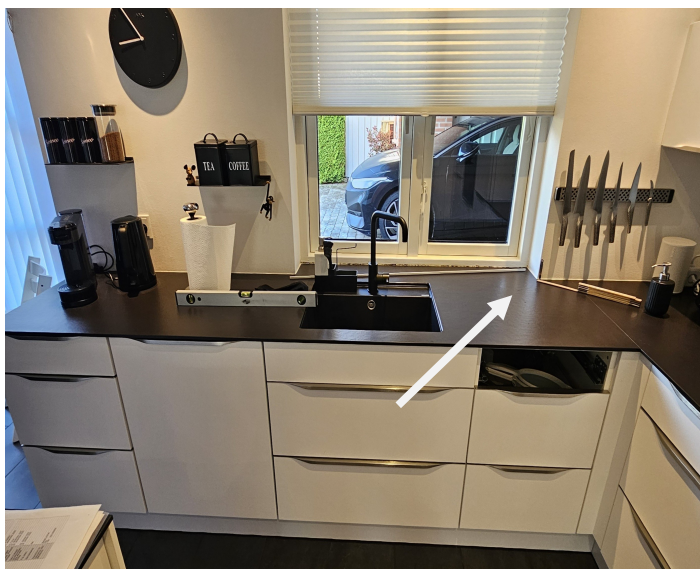
Her området hvor pladen er revnet.