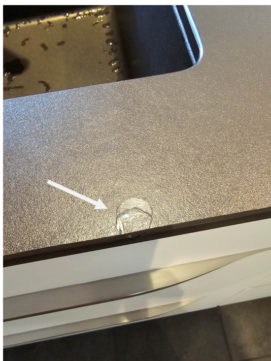
Her ses slagskade ved vasken